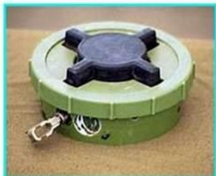
Рис.1 Общий вид мины ПМН-2