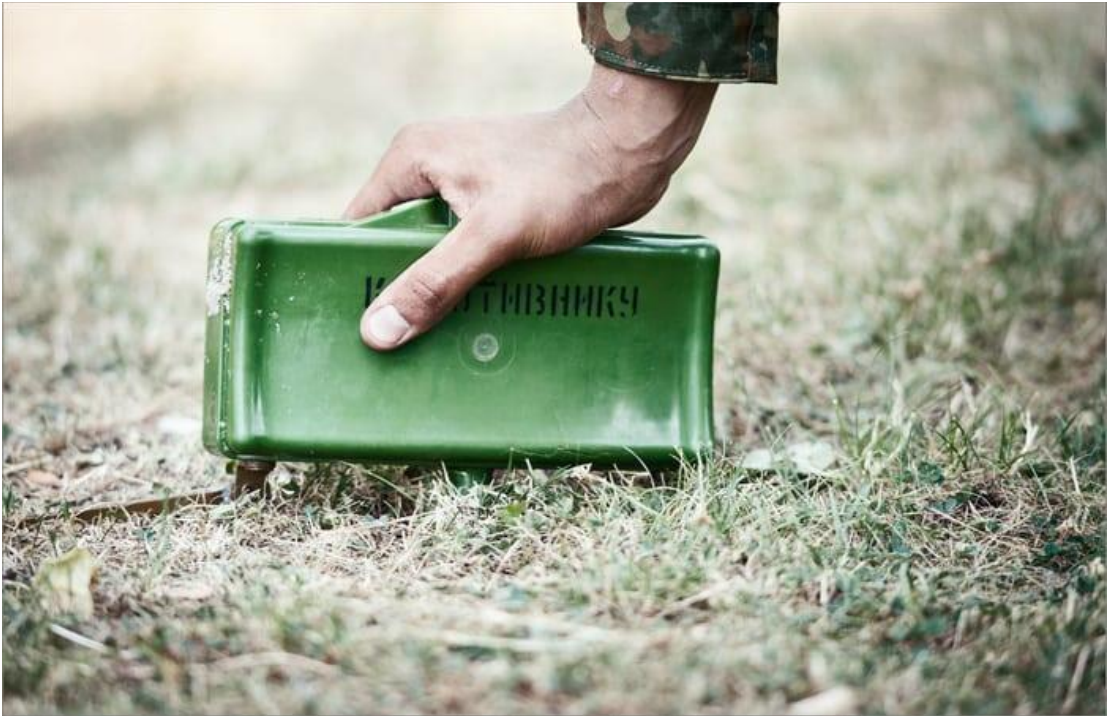
Мина в боевом положении